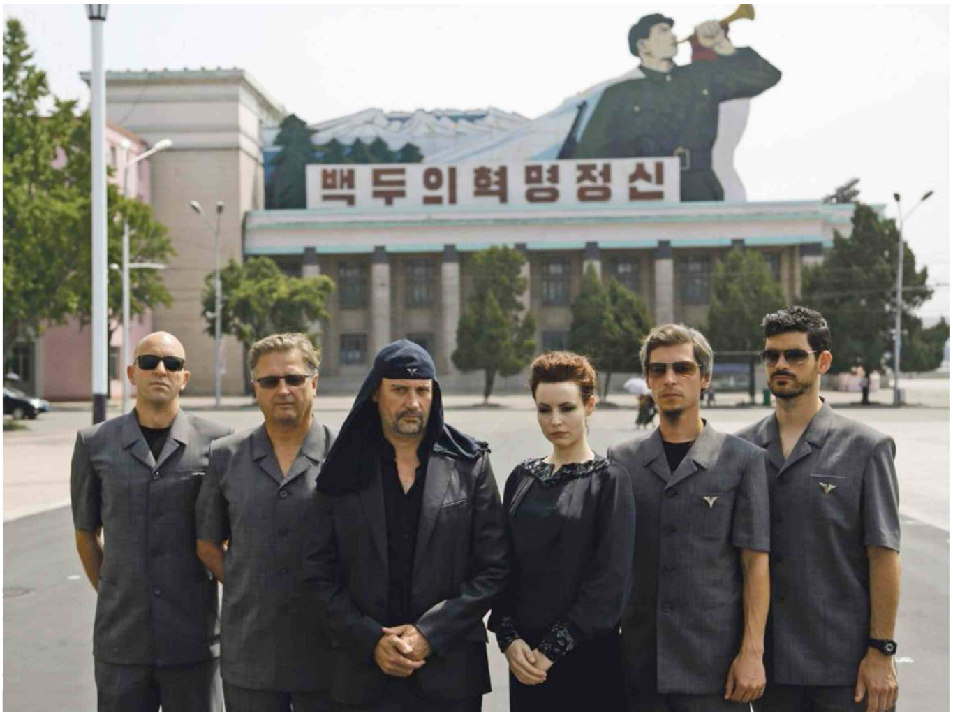
● Laibach v Severni Koreji (zgoraj), prizor iz Iliade (desno).