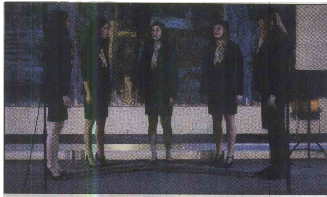
Nastopila je tudi Vokalna skupina Aria iz Dobove.