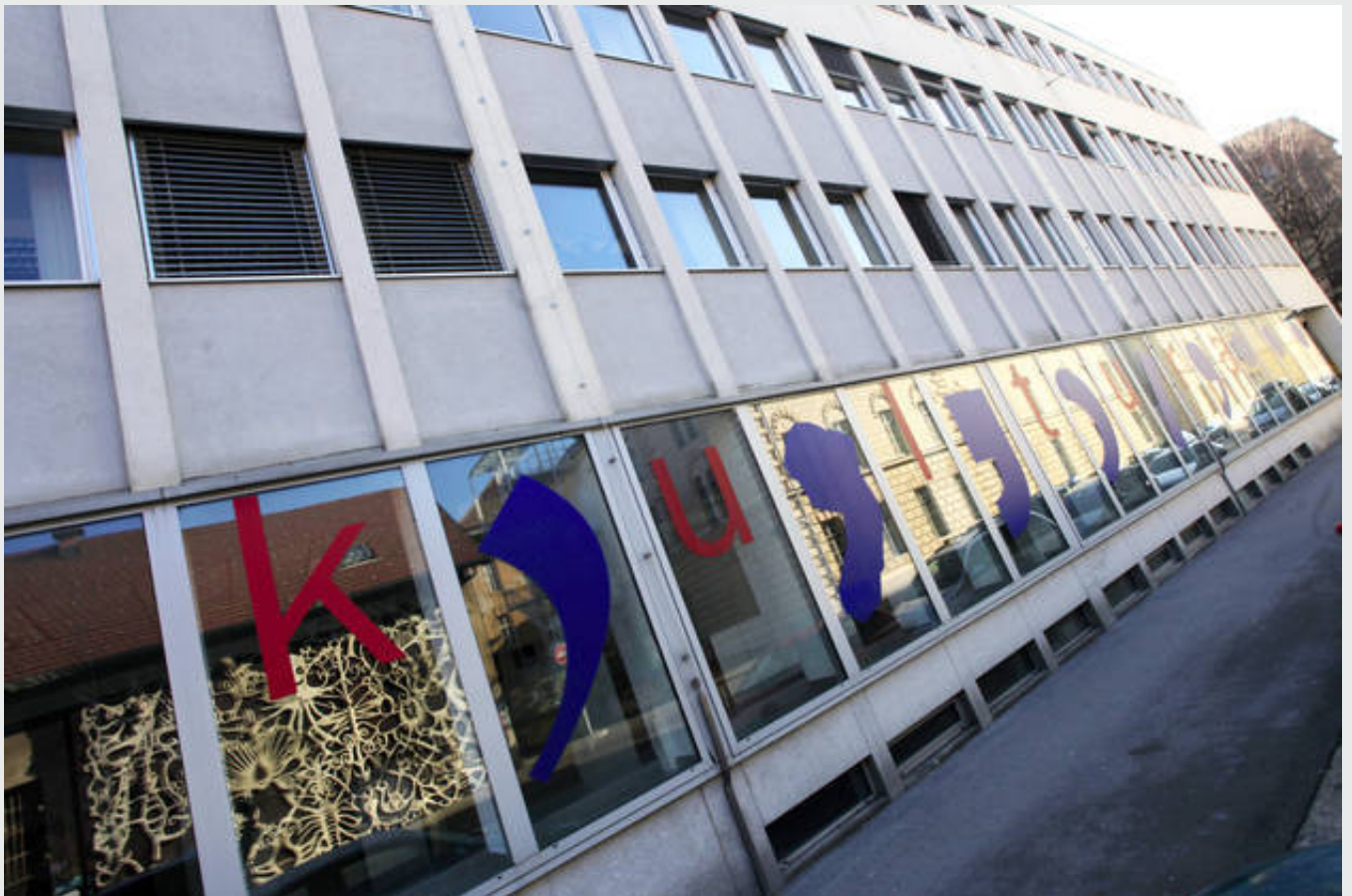
Ministrstvo za kulturo RS

Na Ministrstvu za kulturo (MzK) so včeraj predstavili štiri projekte od štirinajstih, ki naj bi dolgoročno obogatili slovensko kulturno, mlade kulturnike izobrazili in posledično omogočili zaposlitev brezposelnih v kulturi.