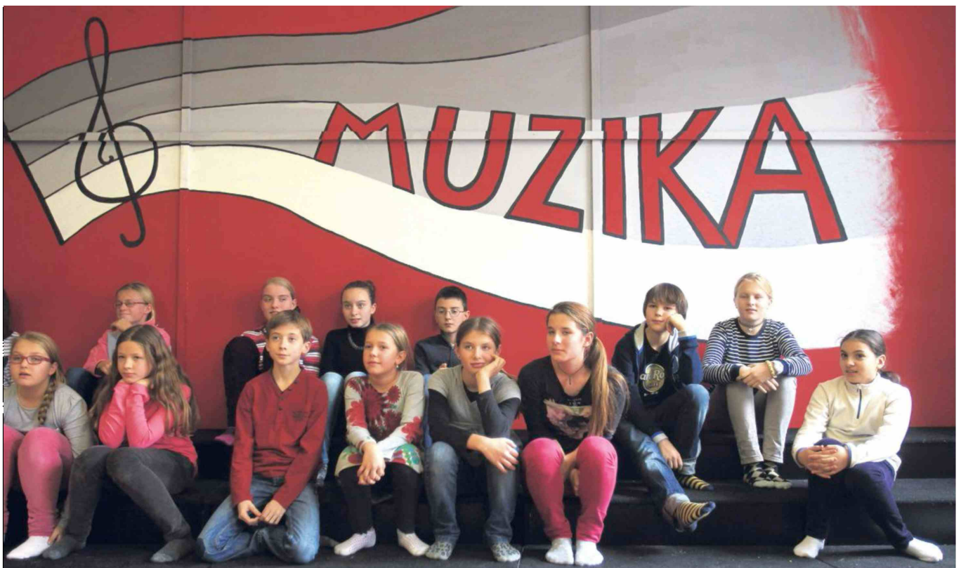
Mladinski pevski zbor OŠ Ledina iz Ljubljane, ki ima za sabo tri mesece intenzivnih priprav, je eden od 12 povabljenih na Potujočo muziko v Gallusovo dvorano Cankarjevega doma.

Mlade pevce bolj kot zabavno prevzame kaj kakovostnega; predlani jim je bila najljubša pesem zboru sužnjev iz Nabucca.