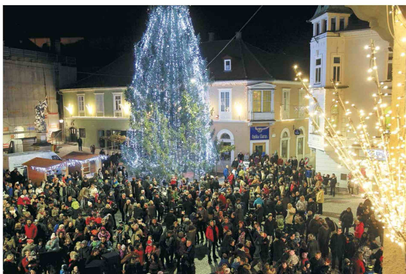
Prižig prazničnih lučk je sinoči privabil množico Ptujčanov. (Igor Napast)