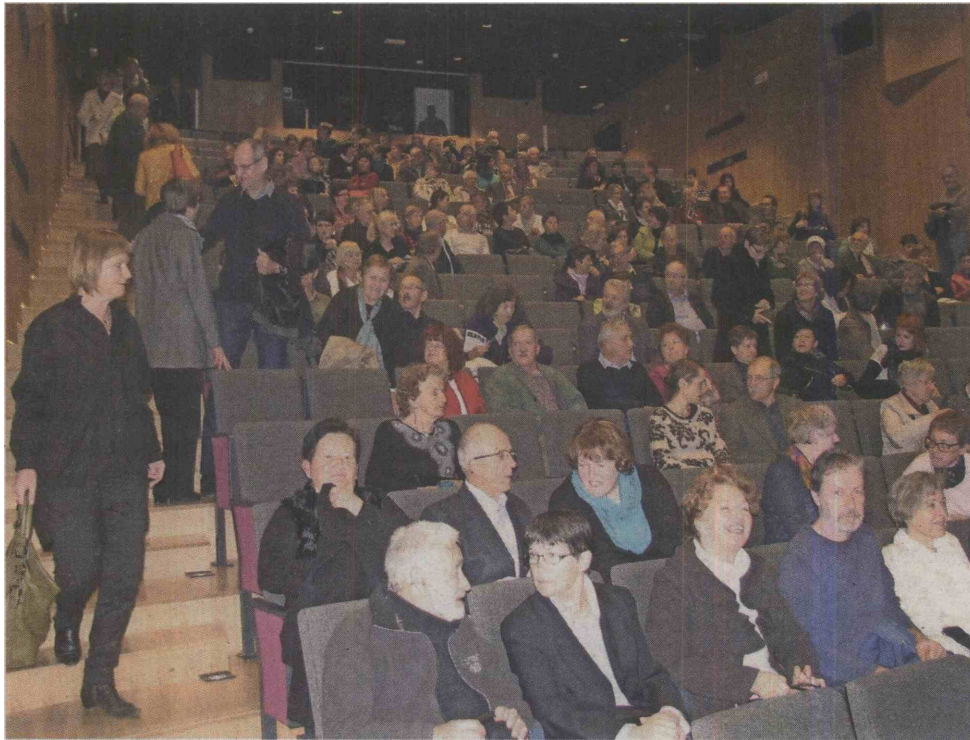
V Tolminu upajo, da bodo snovalci programa, nastopajoči in obiskovalci dodobra prenovljenemu Kinogledališču vdahnili življenje.