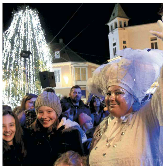
Teta Zima v pravljичnem spremstvu (Igor Napast)