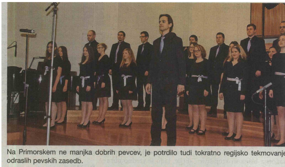
Na Primorskem ne manjka dobrih pevcev, je potrdilo tudi tokratno regijsko tekmovanje odraslih pevskih zasedb.